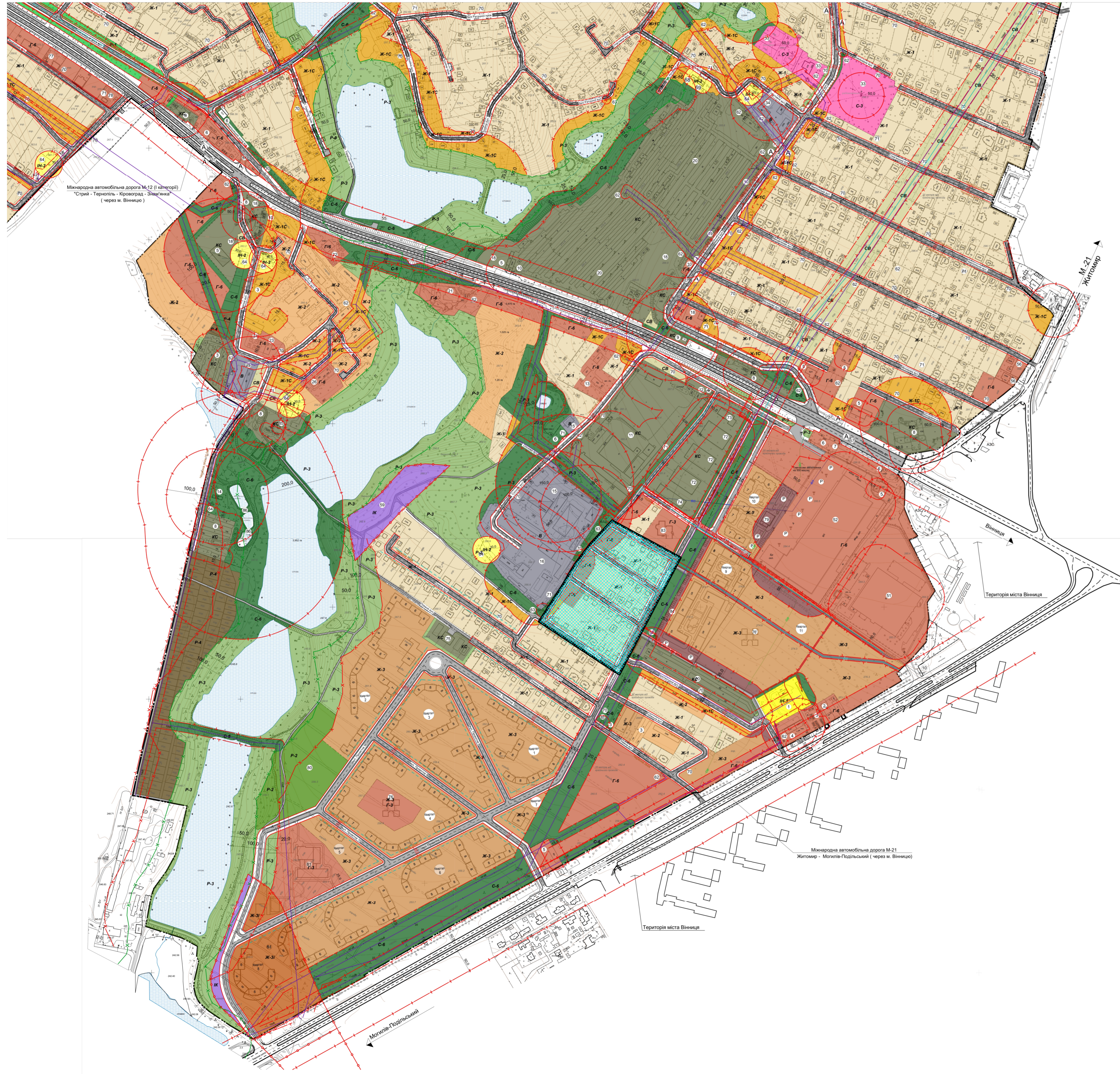
Ситуаційна схема (М 1 : 10000)